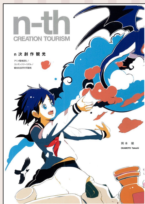
『n次創作観光』（岡本健著、北海道冒険芸術出版）