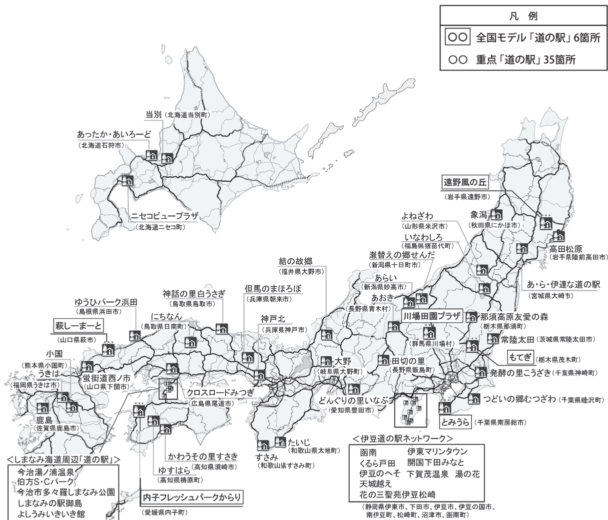
図4 重点「道の駅」選定箇所(平成27年1月30日公表)