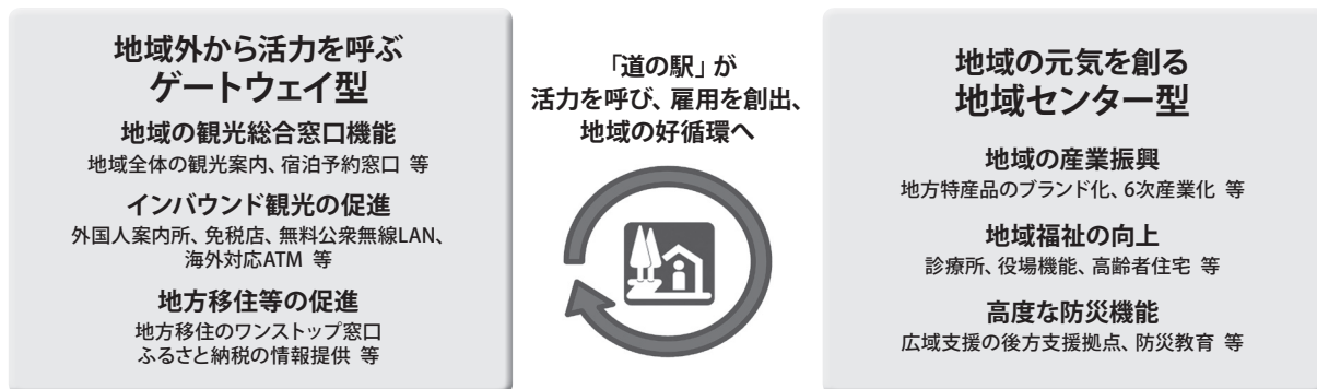
図1 重点「道の駅」に想定される機能

本制度では、地域外から活力を呼ぶ「ゲートウェイ型」と地域の元気を創る「地域センター型」の2つを今後目指していく方向性として掲