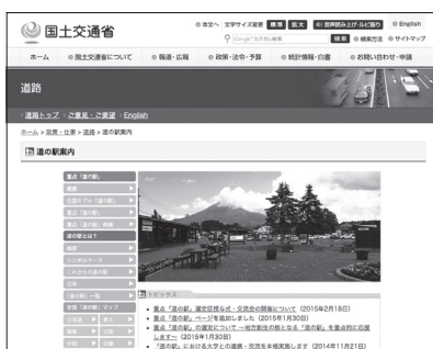
重点「道の駅」の詳細は、「道の駅」ウェブサイト ( http://www.mlit.go.jp/road/Michi-no-Eki/index.html ) をご参照ください。