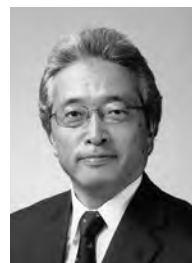
首藤勝次（しゅとう かつじ）

1953年大分県竹田市生まれ。76年大分県直入町役場に就職。主に企画・広報・国際交流の分野を歩み、炭酸泉を縁としたドイツとの国際交流を推進し、姉妹都市締結を実現。大分県議会議員3期を経て、2009年4月より現職。国土交通省の「観光カリスマ」に認定され、全国的に観光振興や地域振興に活躍するリーダー達と幅広い人脈を持つ。現在は、地域主権の確立を目指し、「農村回帰宣言市」を標榜、竹田らしい、竹田にしかできない施策の展開「TOP運動」を通じた「温泉療養保健適用」制度の確立など、全国初のさまざまな挑戦に取り組む。