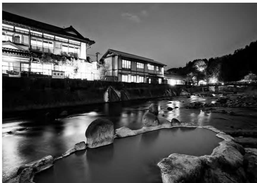
国内屈指の高濃度炭酸泉「長湯温泉」旅館街

でもあつて地域の食の魅力も持っている。温泉を核にして滞在する人たちのニーズを満たせるような多様な魅力が集積されています。地域づくりにはトータルコーディネーターとしていく力が必要ですし、やはり長期滞在するための保養地として「総合力」を持った温泉地形成が大切だと思います。