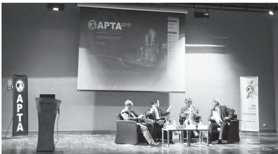
写真 全参加者向けパネルディスカッションの様子

2015年5月14日から17日にかけて、マレーシアのクアラルンプールにおいてAsia Pacific Tourism Association(以下、APTA)の第21回国際会議が開催され、当財団からは筆者を含む3人が参加した。会議への参加報告を行うとともに、APTAにおける研究発表の特徴やパネルディスカッションの内容について紹介したい。