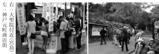
右...大聖院付近(宮島) 左...神戸元町商店街

大阪周遊パス(大阪観光局) ..... P 38 KEIKYU Misaki Maguro Pass/葉山女子旅さび(京浜急行電鉄) ..... P 40