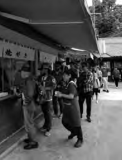
上…飛騨の里(高山市) 左…宮島の焼がき店