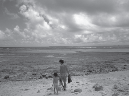
大度浜海岸(沖縄、糸満市)