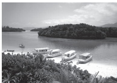
川平湾(沖縄、石垣島)