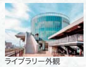
ライブラリー外観