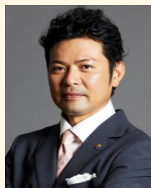
ホテルバームロイヤルNAHA国際通り 代表取締役総支配人