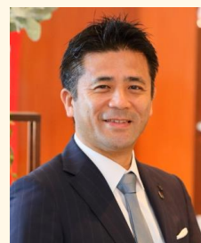
Kafuu Resort Fuchaku CONDO・HOTEL AQUASENSE Hotel & Resort 統括総支配人